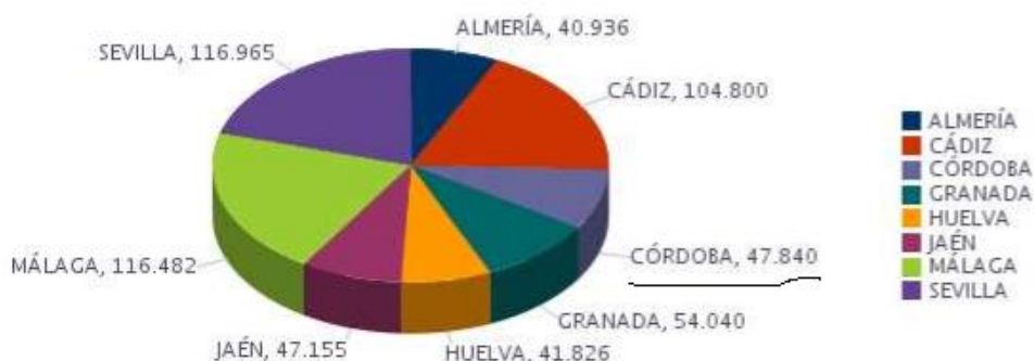
Nº Total Personas con Discapacidad por Provincia

Según este dato, se puede estimar que en Lucena este colectivo está integrado por unas 4.000 personas, de las cuales 408 forman parte AMFE.